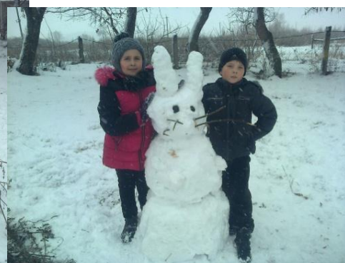
Дорогие ребята и уважаемые учителя!

Редакция газеты «Мы» поздравляет вас с Новым годом и Рождеством! А чтобы у вас поднялось настроение, посмотрите, каких замечательных снеговиков вылепили ребята 2-4 класса во дворе нашей школы!